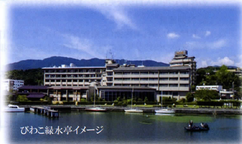
びわこ緑水亭イメージ

「世界遺産」下鴨神社・特別拝観 【十二単衣の着付と王朝の舞】 葵祭等で現在でも使われている「十二単衣」の着付を行う過程と 衣紋(着付)の解説を聞き、着付後、十二単衣姿による王朝の舞を 古式ゆかしく、三井神社舞殿(重要文化財)にてご覧いただきます