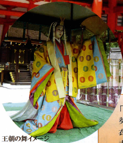
王朝の舞イメージ

「世界遺産」下鴨神社・特別拝観 【十二単衣の着付と王朝の舞】 葵祭等で現在でも使われている「十二単衣」の着付を行う過程と 衣紋(着付)の解説を聞き、着付後、十二単衣姿による王朝の舞を 古式ゆかしく、三井神社舞殿(重要文化財)にてご覧いただきます