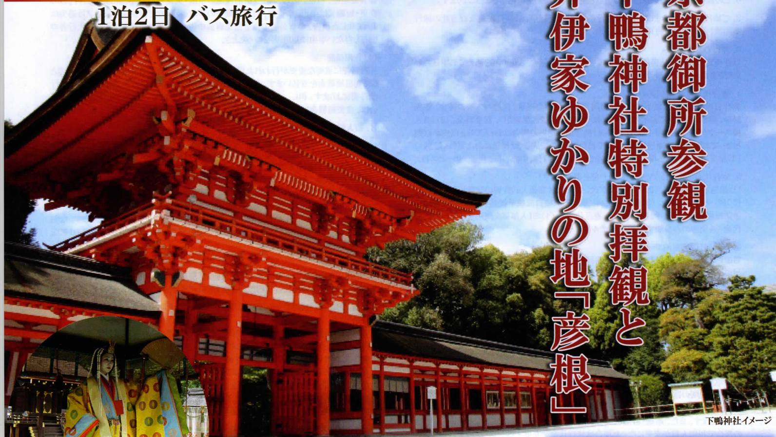
下鴨神社イメージ